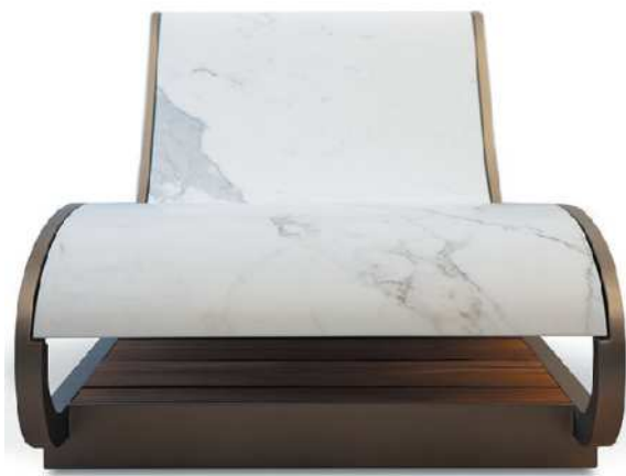
"Vellum", chaise-longue di Sagevan A destra, "Davide", lampada di taglio scultoreo, creata da Slide Design In basso, un'immagine dello studio della poetessa Patrizia Cavalli, scattata dal fotografo Dino Ignani