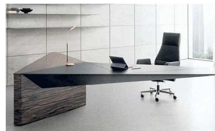
«Euclideo», scrivania disegnata da Ferruccio Laviani. Sopra, la libreria iconica «Casablanca» di Ettore Sottsass, proposta da Memphis

consente ulteriori possibilità di configurazione e, soprattutto, permette di ritagliarsi «pause» di relax durante il lavoro. A dominare nell'arredo dello studio - e non solo - è la filosofia green che vede protagonista il legno, a partire da quello delle cosiddette «foreste urbane», ossia quello dismesso da case, uffici e attività quotidiane, recuperato nei centri raccolta italiani ed europei, per ridare «giovanezza» a mobili ormai inutilizzati, trasformandoli in nuove creazioni o anche in pannelli eco per cambiare l'aspetto di un ambiente. E non è solo questione di tendenze o di fiera, il legno è, da sempre un elemento chiave dello studio, con librerie e scrivanie. E la fantasia le veste di nuove forme e colori accesi per creare inattese suggestioni, capaci di farsi fonte d'ispirazione. Memphis seduce con Casablanca che, progettato nel 1981 da Ettore Sottsass, si rivela però perfetto come simbolo dell'«elasticità» di arredi e funzioni, per la sua duplice natura di libreria, appunto, e anche armadio. Sembra una scultura la scrivania Euclideo di 4 Mariani, progettata da Ferruccio Laviani. «È la combinazione di due volumi che dà vita, da un lato, al piano di lavoro in contrapposizione al mobile, deputato a contenere. Solidi sfaccettati che si compenetrano, definendo volumi e spazi che, a loro volta, delimitano funzioni».