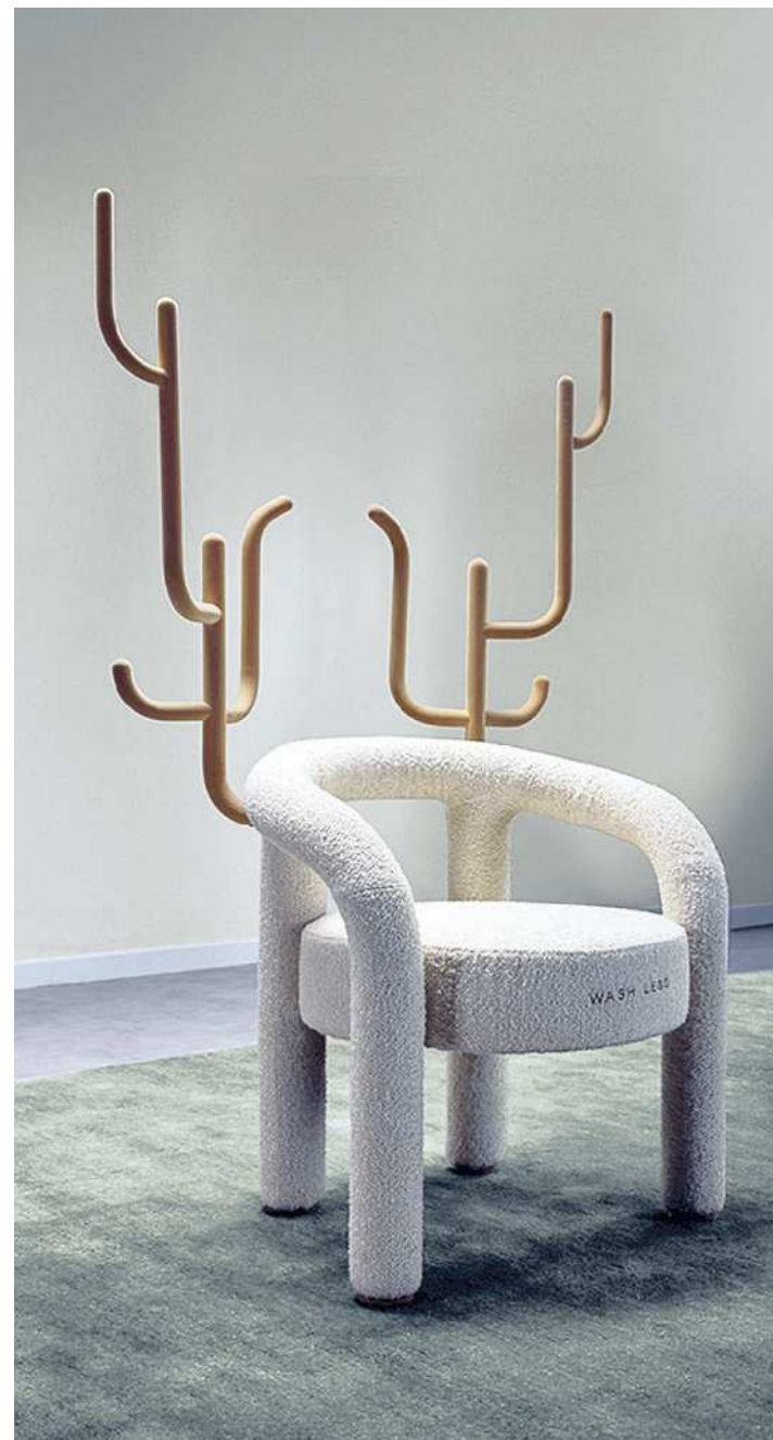
Sopra, «Wash Less», poltrona firmata dallo studio di Fabio Novembre, proposta da Whirlpool in collaborazione con Natuzzi: alla seduta si aggiungono due ramificazioni per appendere capi e soprabiti