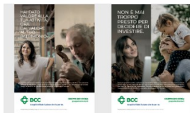
ON AIR IL SECONDO FLIGHT DELLA CAMPAGNA DI COMUNICAZIONE...