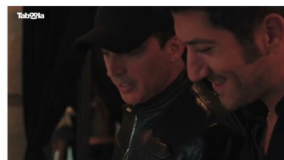
TABOOLA PRESENTA ABBY, L'ASSISTENTE DI AI GENERATIVA CHE...